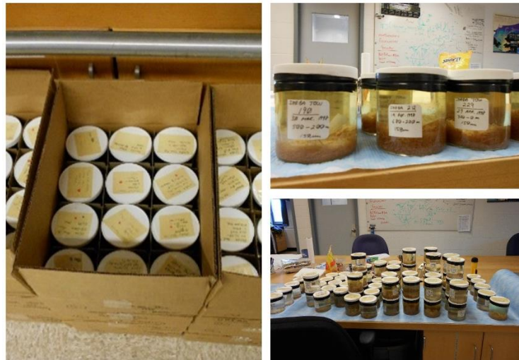
図 1. 氷上定点において 1 年間にわたり採集された動物プランクトン試料。